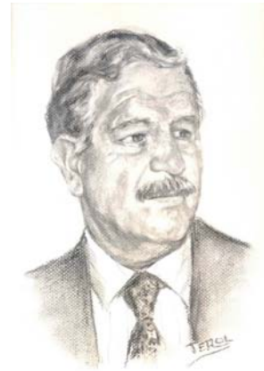
Retrato de Tarilonte