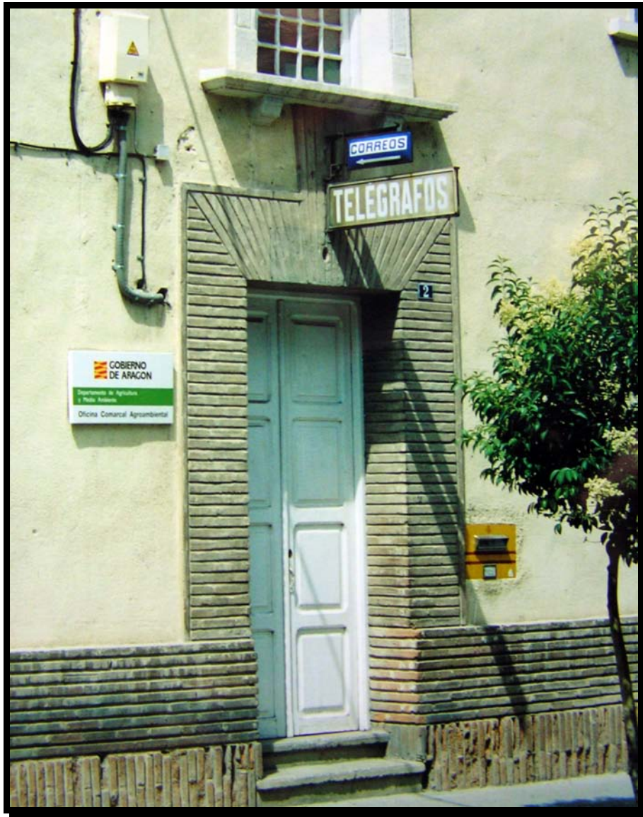
Correos y Telégrafos en la Avenida del Ejército Español. Puerta principal de acceso a las oficinas con sus rótulos

En un momento determinado, se generalizó la celebración del aniversario de la fundación de Telégrafos, y los funcionarios dependientes del Centro de Huesca, organizaban una comida para poder verse y hablar un rato. Yo asistí a alguna de aquellas reuniones, donde conocí a esas personas misteriosas que desde Huesca nos tenían en vilo hasta que sonaba el acústico “dándonos” el cese, o a los jefes de los que se hablaba en casa con una mezcla de miedo y reverencia.