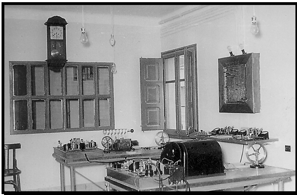
1962. Oficina de Telégrafos en la Avenida del Ejército Español. Se ve la sala de aparatos con el teletipo Siemens en primer término; en la pared de la derecha el conmutador principal para hacer pruebas y, posteriormente, otra mesa con el Morse y los manipuladores. Al fondo, la celosía de la oficina Telebén

Excepto los postes y los aisladores de porcelana, el resto del material telegráfico tuvo que ser importado del extranjero. Para las líneas telegráficas se usaban postes de 7-8 metros de altura, habitualmente, de pino, tratados con sulfato de cobre o creosota, para evitar su putrefacción y los parásitos. Se plantaban a 1'5 m. de profundidad, usando la barra y el cazo o pala larga acodada para sacar la tierra. Cuando en un poste iba más de un hilo, se le añadían crucetas de madera, con aisladores que sujetaban los hilos, inicialmente, de hierro galvanizado y, posteriormente, de bronce o cobre que soportaban mejor la corrosión. El último poste de una línea se denominaba poste de entronque, que empalmaba los hilos interurbanos con los urbanos. El tendido de líneas telegráficas, ante la escasez de vías férreas en España, tuvo que hacerse por caminos, campos y montañas, siendo muy difícil de mantener, a diferencia de las tendidas junto a las vías que permitían el desplazamiento de los celadores y su reparación con más facilidad. Esta red aumentó con el R. D. de 29-I-1889, pues contemplaba la apertura de oficinas en las cabeceras de los partidos judiciales y en las redacciones de los periódicos.